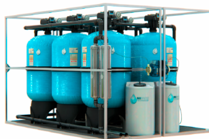
SISTEMA DE FILTRACIÓN