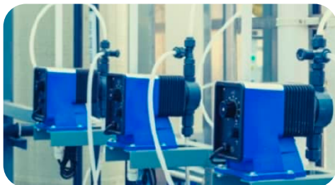
SISTEMAS DE BOMBEO Y DOSIFICACIÓN